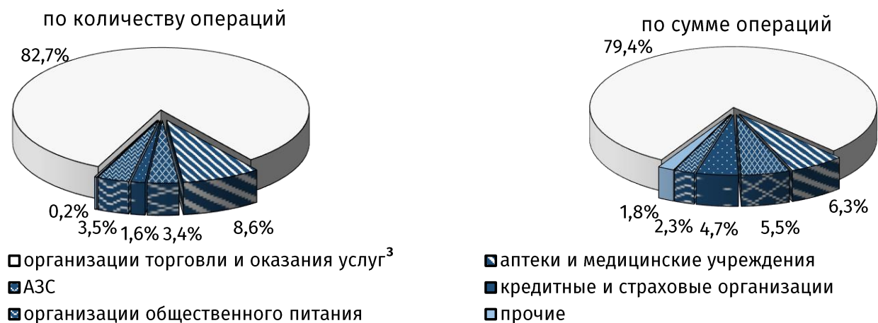
Рис. 2. Структура безналичных операций в пунктах размещения платёжного оборудования в декабре 2021 года, %

Сумма операций по переводу физическими лицами денежных средств с карты на карту увеличилась на 41,0%, до 109,8 млн руб. (8,5% в совокупном показателе). Средний размер одного денежного перевода составил 658,1 руб. против 634,1 руб. месяцем ранее.