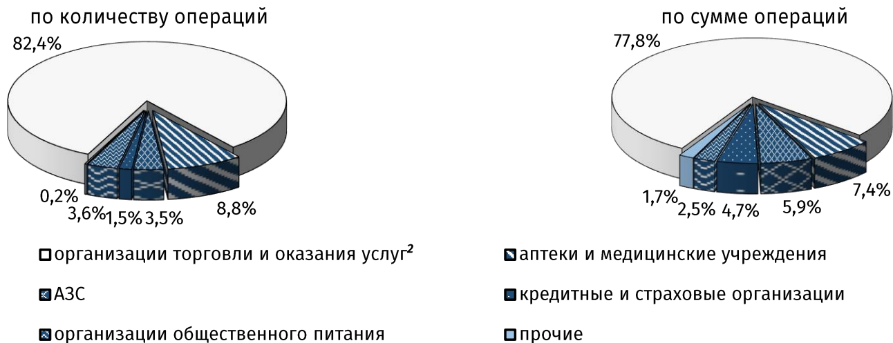
Рис. 2. Структура безналичных операций в пунктах размещения платёжного оборудования в ноябре 2021 года, %

Объём денежных средств, переведённых физическими лицами с карты на карту, увеличился за месяц на 7,9%, до 77,9 млн руб. (7,6% в совокупном показателе). Средний размер одного денежного перевода составил 634,1 руб. против 625,2 руб. в октябре 2021 года.