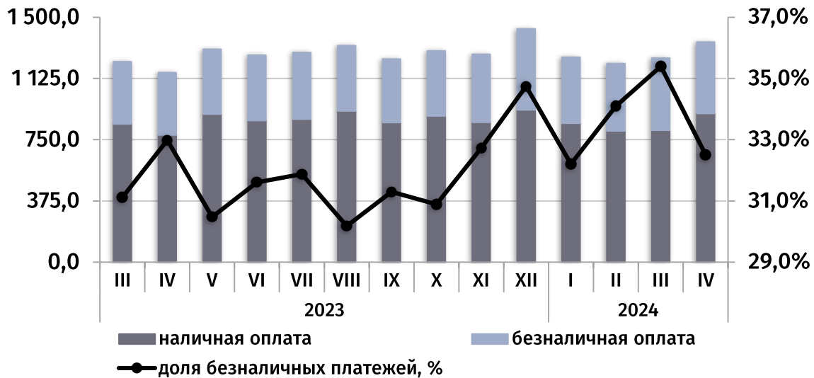
динамика потребительского рынка, ежемесячно (в текущих ценах, млн руб.)