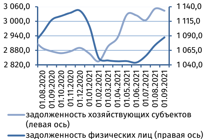
Рис. 4. Динамика задолженности по кредитам, 2 млн руб.

Результаты деятельности коммерческих банков республики в августе 2021 года характеризовались формированием чистой прибыли в сумме 15,9 млн руб., что на 10,7% меньше, чем в июле текущего года, и на 12,8% превысило показатель августа 2020 года.