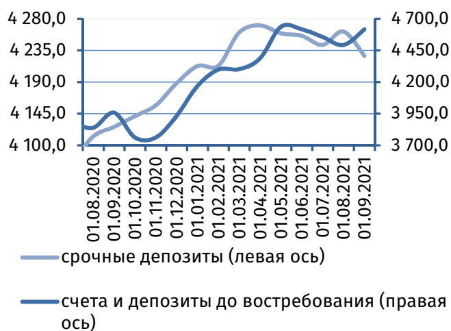
Рис. 2. Динамика депозитной базы, млн руб.

Основу динамики привлечённых ресурсов сформировал приток средств на счета юридических лиц на сумму 123,1 млн руб. (+2,3%), до 5 442,0 млн руб., вследствие пополнения текущих счетов – на 165,6 млн руб. (+5,1%), до 3 391,7 млн руб. В то же время остатки на срочных депозитах корпоративных клиентов сократились на 42,5 млн руб. (-2,0%), до 2 050,3 млн руб.