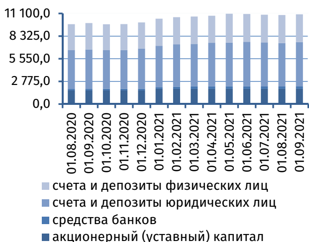
Рис. 1. Динамика основных видов пассивов, млн руб.

Совокупный объём средств клиентов 1 банков на срочных депозитах и депозитах до востребования увеличился на 89,1 млн руб. (+1,0%), до 8 843,43 млн руб. Его структурные компоненты характеризовались расширением онкольных обязательств на 123,8 млн руб. (+2,8%), до 4 616,3 млн руб., при сокращении срочной депозитной базы на 34,7 млн руб. (-0,8%), до 4 227,1 млн руб. (рис. 2).