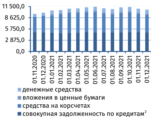
Рис. 3. Динамика основных видов активов, млн руб.