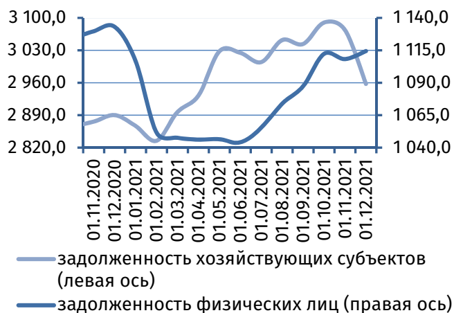
Рис. 4. Динамика задолженности по кредитам, 2 млн руб.

Совокупный кредитный портфель коммерческих банков за отчётный месяц сократился на 2,3%. Основным фактором данной динамики выступило активное гашение ранее сформированной задолженности по кредитам 2 субъектов реального сектора экономики, в результате чего остаток обязательств корпоративных клиентов снизился на 116,2 млн руб. (-3,8%), до 2 957,6 млн руб. (рис. 4). Сжатием характеризовалось и межбанковское кредитование – на 4,4 млн руб. (-2,4%), объём которого на 1 декабря 2021 года составил 180,9 млн руб. В то же время возобновился рост потребительского кредитования – задолженность физических лиц увеличилась на 6,2 млн руб. (+0,6%), до 1 114,4 млн руб.