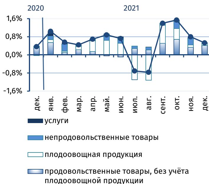
Рис. 3. Вклад основных компонент в сводный индекс потребительских цен, п.п.

Как и на рынках большинства стран партнёров (+0,3% в России и Украине, +0,6% в Молдове), в республике продолжился рост цен на медикаменты (+0,9%), что также было сопряжено с повышенным спросом. На 2,0% увеличилась стоимость вычислительной техники. Цены на ткани, одежду, табачные изделия, канцтовары и товары бытовой химии практически не изменились. По всем остальным группам товаров были зафиксированы повышательные корректировки в диапазоне +0,2%-0,8%, в частности: обувь, мебель, моющие средства, посуда, хозтовары, стройматериалы и т.д.