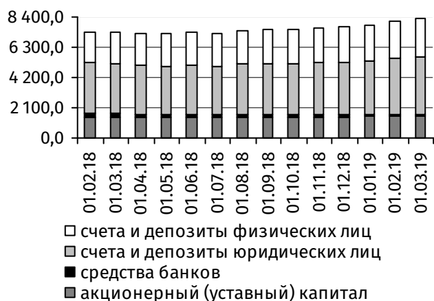
Рис. 1. Динамика основных видов пассивов, млн руб.

Балансовая стоимость акционерного капитала коммерческих банков осталась на уровне начала отчётного месяца – 1 564,8 млн руб. (рис. 1).