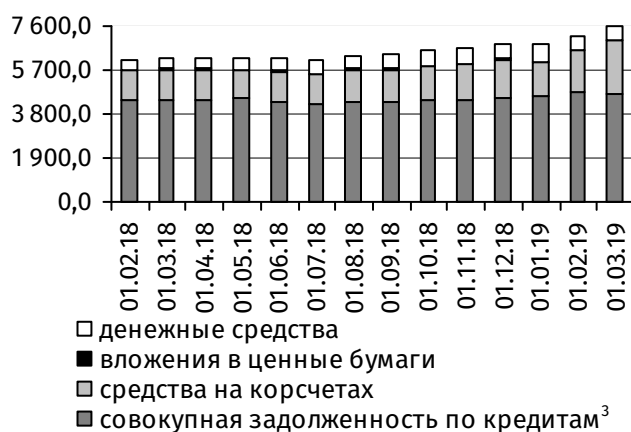
Рис. 3. Динамика основных видов активов, млн руб.

Объём привлечённых средств населения за отчётный месяц расширился на 49,6 млн руб., или на 1,9%, до 2 645,5 млн руб. Приток наблюдался как на депозиты до востребования (+41,2 млн руб., до 740,7 млн руб.), так и на срочные вклады граждан (+8,4 млн руб., до 1 904,8 млн руб.).