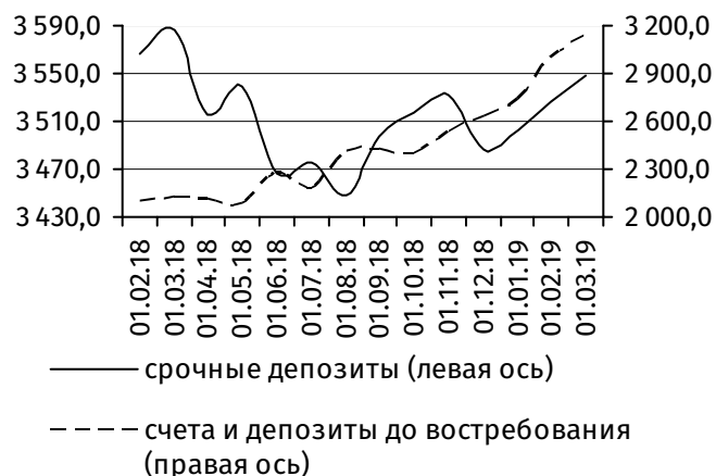
Рис. 2. Динамика депозитной базы, млн руб.

Совокупная величина клиентской базы 2 возросла на 183,5 млн руб. (+2,8%), составив 6 700,0 млн руб. В её структуре онкольные обязательства увеличились на 161,6 млн руб. (+5,4%), до 3 152,0 млн руб., срочная депозитная база – на 21,9 млн руб. (+0,6%), до 3 548,0 млн руб. (рис. 2).