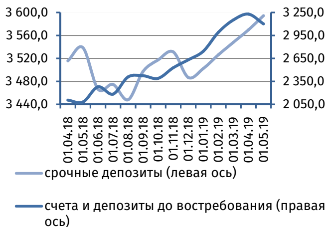
Рис. 2. Динамика депозитной базы, млн руб.

Величина клиентской базы 2 сократилась на 102,9 млн руб. (-1,5%), составив 16 695,3 млн руб. Это стало следствием оттока средств с текущих счетов и депозитов до востребования: за апрель 2019 года их сумма уменьшилась на 127,6 млн руб. (-4,0%), до 3 100,9 млн руб. Совокупный объём срочных депозитов, напротив, увеличился на 24,7 млн руб. (+0,7%), до 3 594,4 млн руб. (рис. 2).