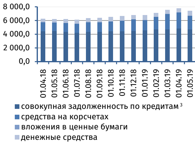
Рис. 3. Динамика основных видов активов, млн руб.