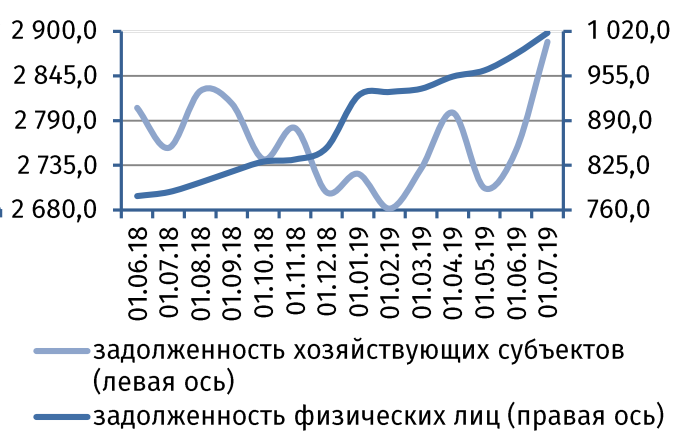
Рис. 4. Динамика задолженности по кредитам, 4 млн руб.