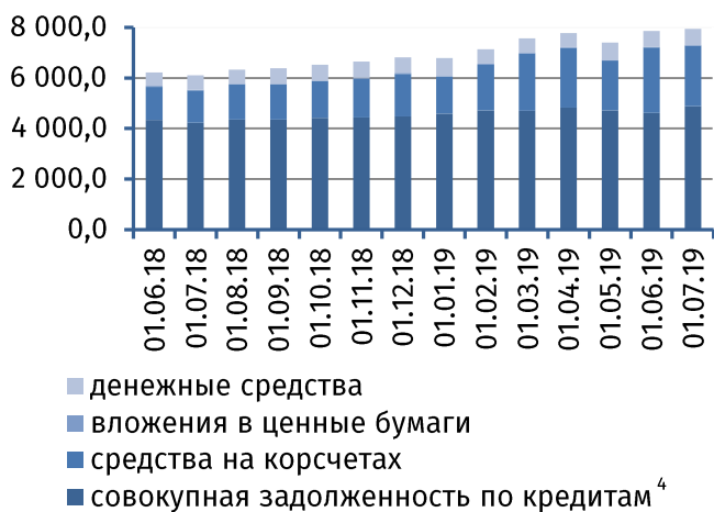
Рис. 3. Динамика основных видов активов, млн руб.