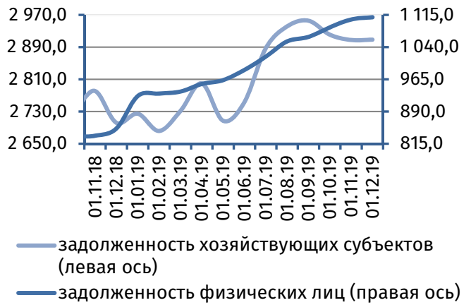
Рис. 4. Динамика задолженности по кредитам, 4 млн руб.

Результаты деятельности коммерческих банков республики в ноябре 2019 года характеризовались формированием чистой прибыли на уровне 13,5 млн руб. (в октябре – 24,3 млн руб.).