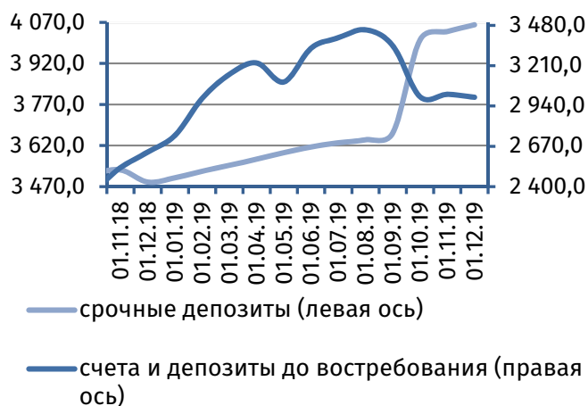
Рис. 2. Динамика депозитной базы, млн руб.

Совокупная величина клиентской базы 2 незначительно возросла (на 4,9 млн руб., или на 0,1%), составив 7 059,7 млн руб. Поддержание данной динамики в области положительных значений обеспечено расширением срочной депозитной базы на 24,5 млн руб. (+0,6%), до 4 061,2 млн руб., тогда как онкольные обязательства сократились на 19,7 млн руб. (-0,7%), до 2 998,4 млн руб. (рис. 2).