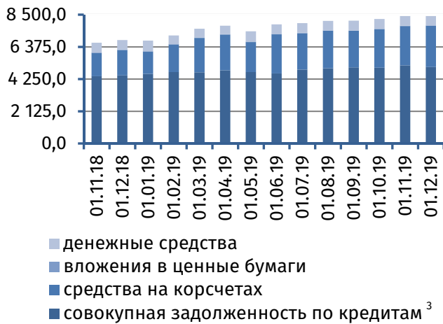
Рис. 3. Динамика основных видов активов, млн руб.