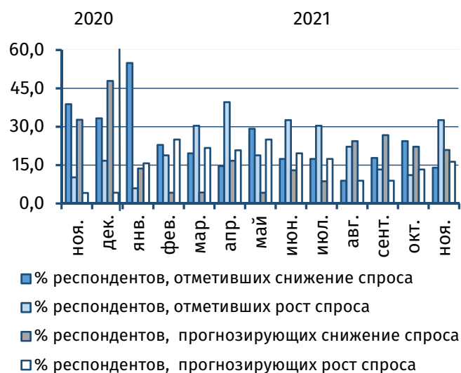
Рис. 2. Оценка текущего и прогнозного уровня спроса, % от общего числа респондентов

На фоне высоких ноябрьских результатов деловые ожидания приднестровских экономических агентов на декабрь были более сдержанными. Большинство участников опроса при оценивании перспектив динамики выпуска и спроса в декабре придерживались нейтральной позиции – 41,9% и 53,5% соответственно (рис. 2, 3). Увеличение промышленного производства ожидают 18,6% (-8,1 п.п.) опрошенных, тогда как его сокращение прогнозируют 27,9% (+5,7 п.п.) руководителей. На повышение спроса рассчитывают 16,3% (+3,0 п.п.) респондентов, 20,9% (-1,3 п.п.) считают, что в декабре произойдёт его сокращение.