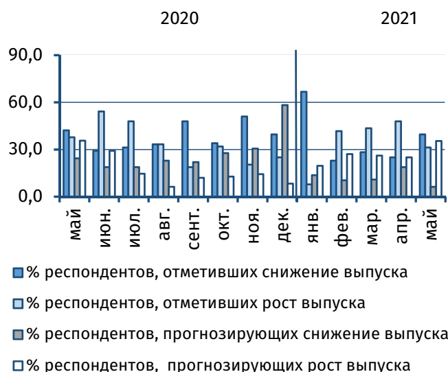
Рис. 3. Оценка текущего и прогнозного объёма выпуска, % от общего числа респондентов