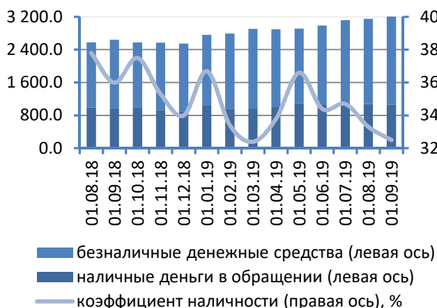
Рис. 1. Динамика национальной денежной массы, млн руб.

Денежная масса, номинированная в иностранной валюте, увеличилась на 77,4 млн руб. (+1,3%), до 5 987,2 млн руб. Степень валютизации совокупного денежного предложения составила 65,2%.