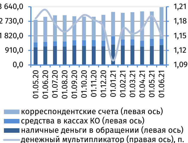
Рис. 2. Динамика денежной базы, млн руб.

Размер денежной базы возрос на 271,2 млн руб. (+8,1%), сложившись на 1 июня 2021 года на уровне 3 628,0 млн руб. (рис. 2), что обусловлено увеличением остатков средств на корреспондентских счетах кредитных организаций в Приднестровском республиканском банке на 280,9 млн руб. (+16,4%), до 1 989,4 млн руб. Величина обязательств центрального банка по выпущенным наличным денежным средствам (включая остатки в кассах кредитных организаций) сократилась на 9,6 млн руб. (-0,6%), до 1 626,1 млн руб.