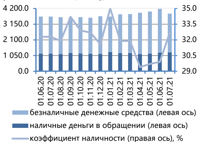
Рис. 1. Динамика национальной денежной массы, млн руб.

Денежное предложение с учетом средств, номинированных в иностранной валюте, на 1 июля 2021 года составило 11 390,9 млн руб. Степень валютизации полной денежной массы увеличилась до 66,1% (+3,0 п.п.).