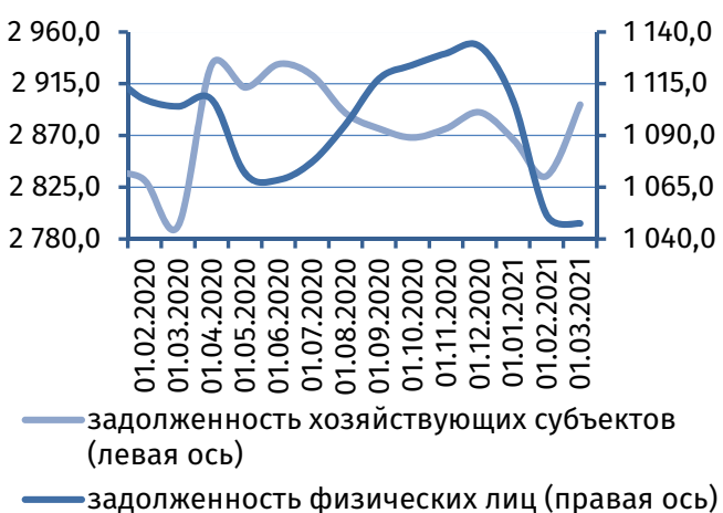
Рис. 4. Динамика задолженности по кредитам, 2 млн руб.

Результаты деятельности коммерческих банков республики в феврале 2021 года характеризовались формированием чистой прибыли в сумме 7,9 млн руб., что на 14,1% меньше, чем в январе текущего года и феврале 2020 года.