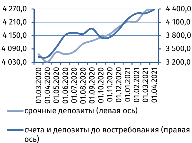
Рис. 2. Динамика депозитной базы, млн руб.

Остатки средств на счетах юридических лиц возросли на 136,9 млн руб. (+2,6%), до 5 347,4 млн руб., что обусловлено в основном пополнением текущих счетов на 130,2 млн руб. (+4,2%), до 3 229,8 млн руб. Остатки срочных депозитов корпоративных клиентов увеличились на 6,6 млн руб. (+0,3%) и сложились в объёме 2 117,5 млн руб.