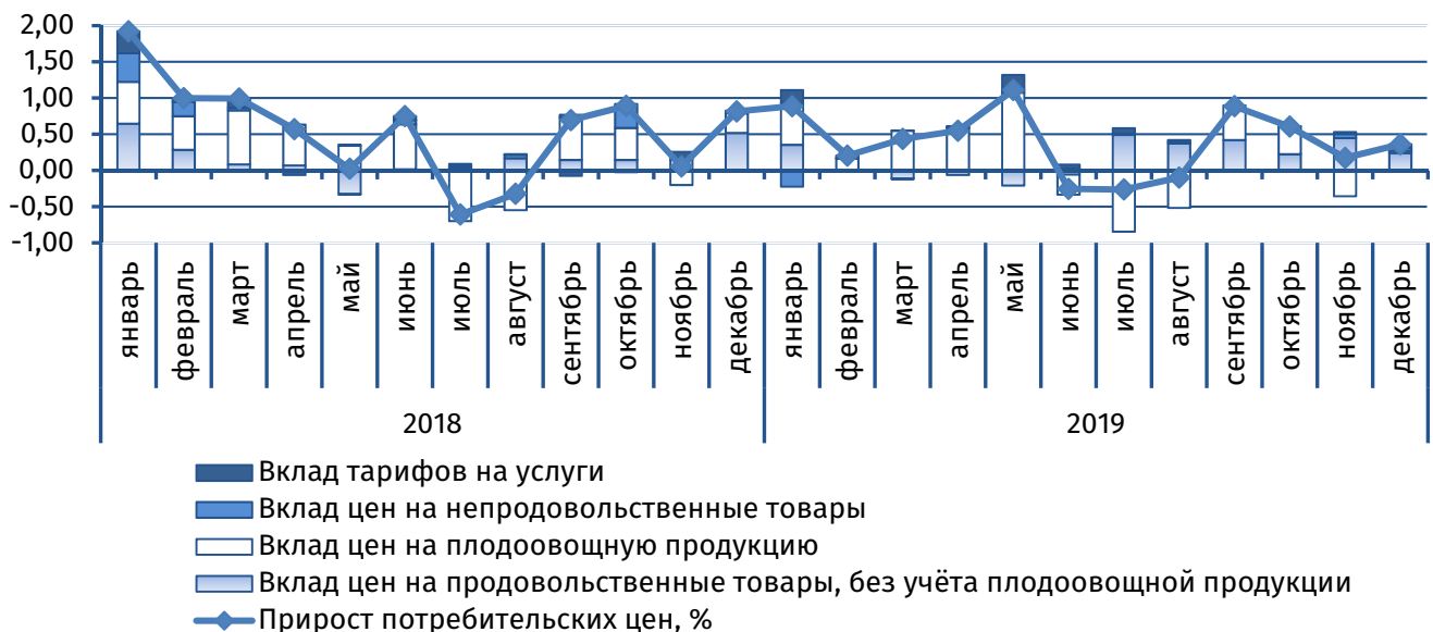
Рис. 1. Вклад основных компонент в сводный индекс потребительских цен, п.п.

Основной вклад в формирование сводного индекса внёс продовольственный сегмент (0,27 п.п.), уровень цен в котором возрос на 0,7% (+1,9% в декабре 2018 года). Повышательная стоимостная динамика отмечалась по ряду продуктов животного происхождения: молочная продукция (+1,9%), яйца (+3,2%), что в целом коррелировало с динамикой на рынках стран-партнёров и во многом было обусловлено сезонным сужением предложения. В декабре также возросли цены на хлебобулочные (+0,3%), макаронные (+0,8%) и крупяные (+0,9%) изделия.