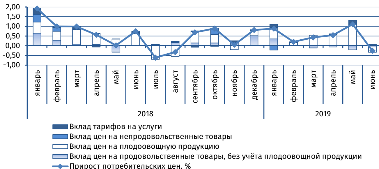
Рис.1. Вклад основных компонент в сводный индекс потребительских цен, п.п.

В июне впервые с начала текущего года в республике фиксировалась дефляция – стоимость стандартного набора товаров и услуг снизилась на 0,3%, в то время как годом ранее наблюдалась обратная тенденция – +0,8%. Основу понижательной динамики определял продовольственный сегмент (-0,8%). В наибольшей степени, ввиду сезонного влияния, снизилась стоимость плодоовощной продукции – -3,8%, её вклад в совокупный индекс цен традиционно стал определяющим (рис. 1). Расширение предложения обусловило уменьшение стоимости картофеля – на 4,4% и овощей – на 11,2%. Сокращение цен на овощи отмечалось и на рынках стран-партнёров (-20,0% в России, -14,4% в Молдове, -14,3% в Украине). Стоимость фруктов, напротив, возросла на 4,8%, что также коррелировало с динамикой на рынках рассматриваемых стран (+3,6% в России, +7,4% в Молдове, +9,3% в Украине).