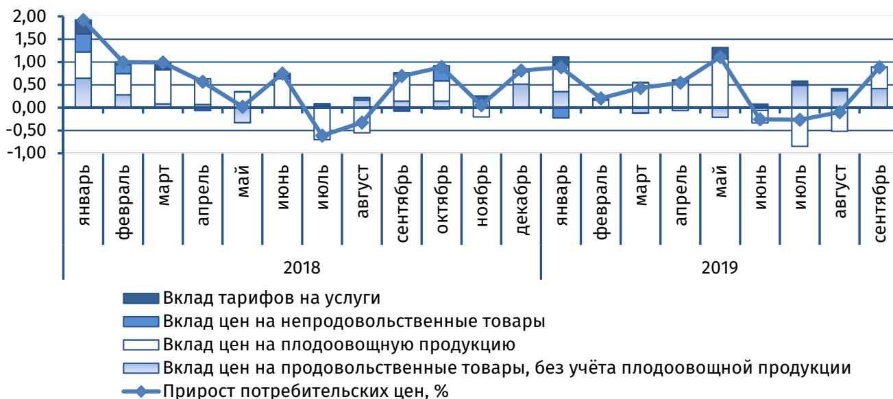
Рис. 1. Вклад основных компонент в сводный индекс потребительских цен, п.п.

Во внутригодовой динамике после дефляции, наблюдаемой в период с июня по август, в сентябре была отмечена инфляция – стоимость стандартного набора потребительских товаров и услуг увеличилась на 0,9% (+0,7% в сентябре 2018 года).