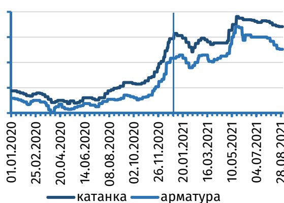
Рис. 2. Цена арматуры и катанки на рынке Турции, долл.