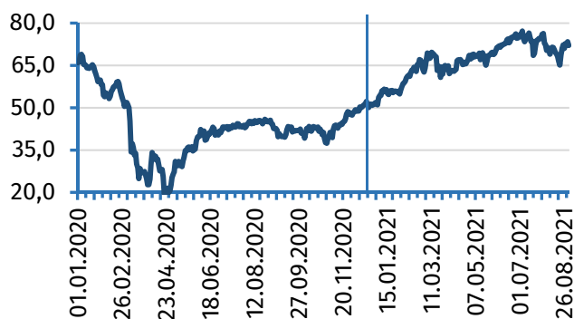
Рис. 1. Цена нефти марки Brent, долл.

Чёрные металлы. Цены на металлолом также снизились на региональных рынках из-за продолжающегося ослабления спроса на арматуру и катанку. На рынке Турции цены на арматуру и катанку к концу августа опустились до минимальных значений с начала мая текущего года – до 682,5 долл. и 790,0 долл. соответственно (рис. 2). Показателям на начало месяца они уступили 7,1% и 3,1% соответственно, при этом сохранилось превышение уровней на начало года (+6,6% и +4,3% соответственно).