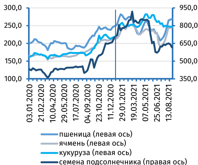
Рис. 3. Цена зерновых и масличных культур на рынке Украины, долл.

В условиях низкой востребованности кукурузы урожая предыдущего года её стоимость снизилась на 1,2% (+12,3% к 01.01.2021). На фоне сбора нового урожая и сокращения спроса на растительное масло украинского производства на мировом рынке котировки семян подсолнечника упали на 3,1% к концу месяца (+12,9% к 01.01.2021).